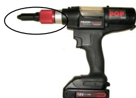
写真1 新 PB2500