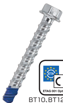
BT10, BT12, BT16