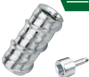
スネイク専用セッティングツール 差込角 12.7(全サイズ)